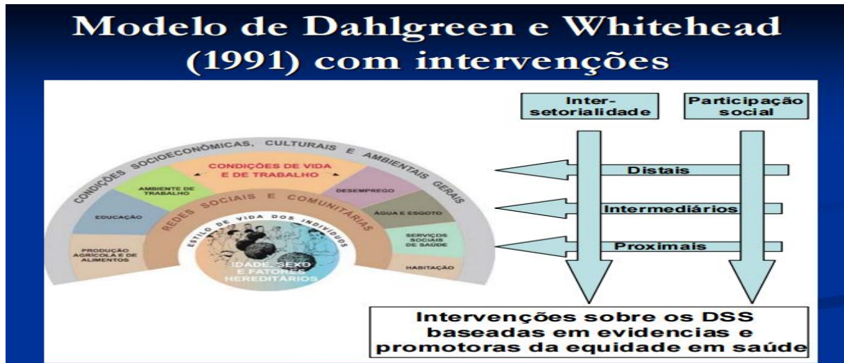
Figura 18 – determinantes sociais da saúde

Os determinantes sociais da saúde tendem a incluir toda a trama social como objeto de responsabilidade dos sistemas de saúde, já que fatores como a distribuição de renda, política de emprego, controle do ambiente, urbanização, todos interferem na saúde da população.