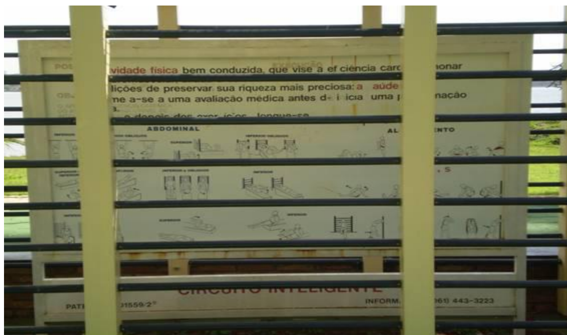
Figura 13 – Foto ilustrativa do circuito inteligente

As atividades com os participantes devem se concentrar em quatro exigências básicas, exercícios de condicionamento cardiovascular, de flexibilidade, de resistência e de desenvolvimento muscular. Predominando o objetivo de atividades para a quebra de tensão, provinda do cotidiano, como higiene mental e/ou como prática de lazer.