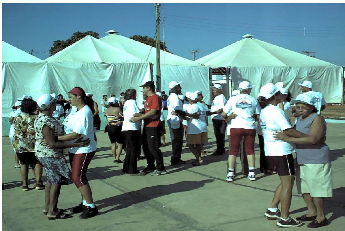
Figura – 09 – Lazer através da dança para os idosos

As atividades dos Amigos em movimento deverá ser realizada na sede social da ADP90 quando da inauguração de sua sede que transformará também em Centro Regional de Convivência dos Idosos da região do Pedra 90.