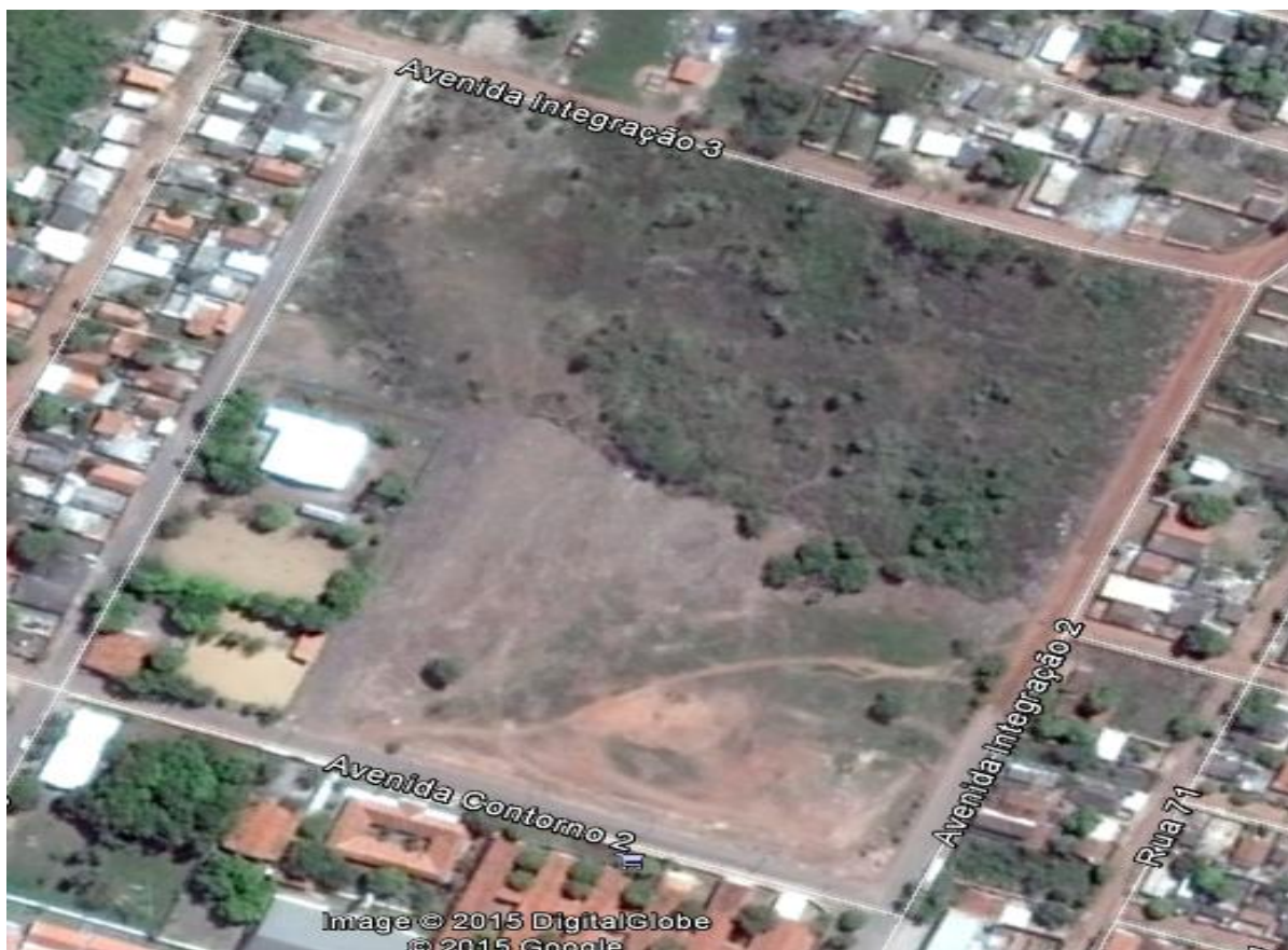
Figura 16 – Área verde do Pedra 90

A proposta da ADP90 é transformar esse meio ambiente totalmente arborizado para que a população desta região possa desfrutar de um meio ambiente sadio longe da poluição com pistas iluminadas para a prática de esporte noturno, visto que a grande maioria da população do Pedra 90 trabalha durante o dia e não se tem opção durante o período noturno de alguma atividade física e ao mesmo tempo propiciar qualidade de vida a toda comunidade. É importante salientar que deve ser elaborado um projeto específico para esta ação.