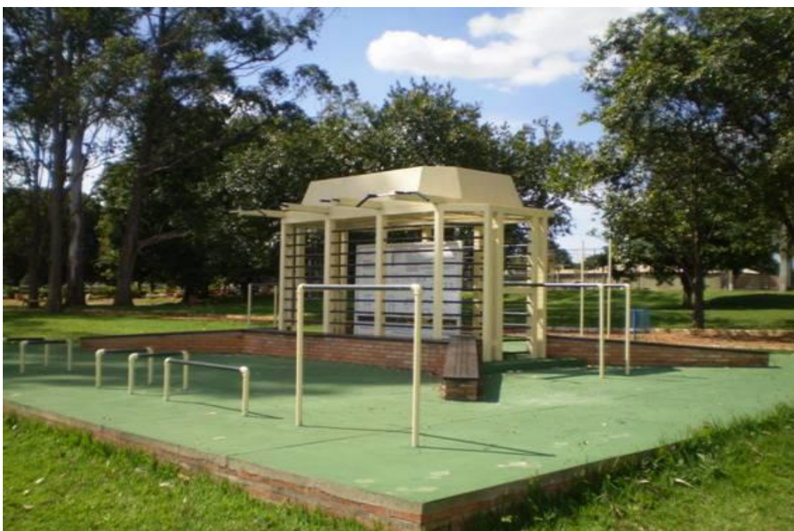
Figura 10 – Modelo de um equipamento público completo

A prática da musculação é direcionada ao bem estar e ao condicionamento físico geral e especialmente o aumento da força, atividade também considerada um tratamento para diversas afecções do organismo, tais como obesidade, magreza, distúrbios posturais, dores das articulações e da coluna vertebral e outros. Sendo uma atividade propícia para toda pessoa adulta, por proporcionar mudanças no comportamento, perante as situações do cotidiano.