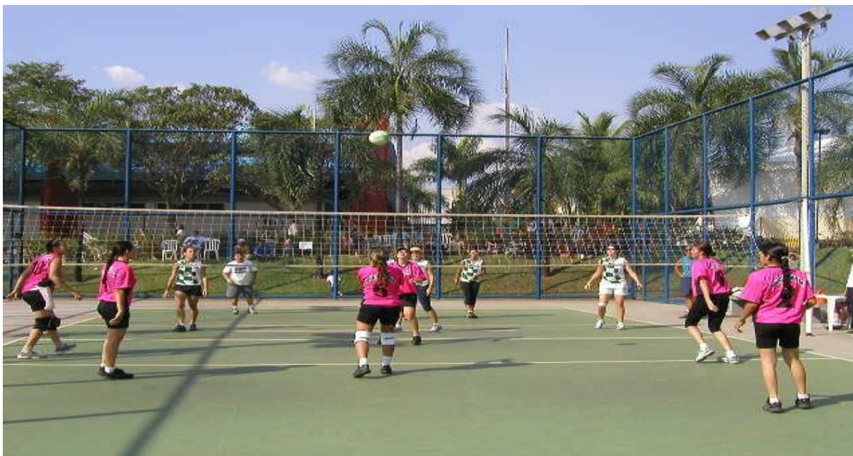
Figura 11 – Foto ilustrativa