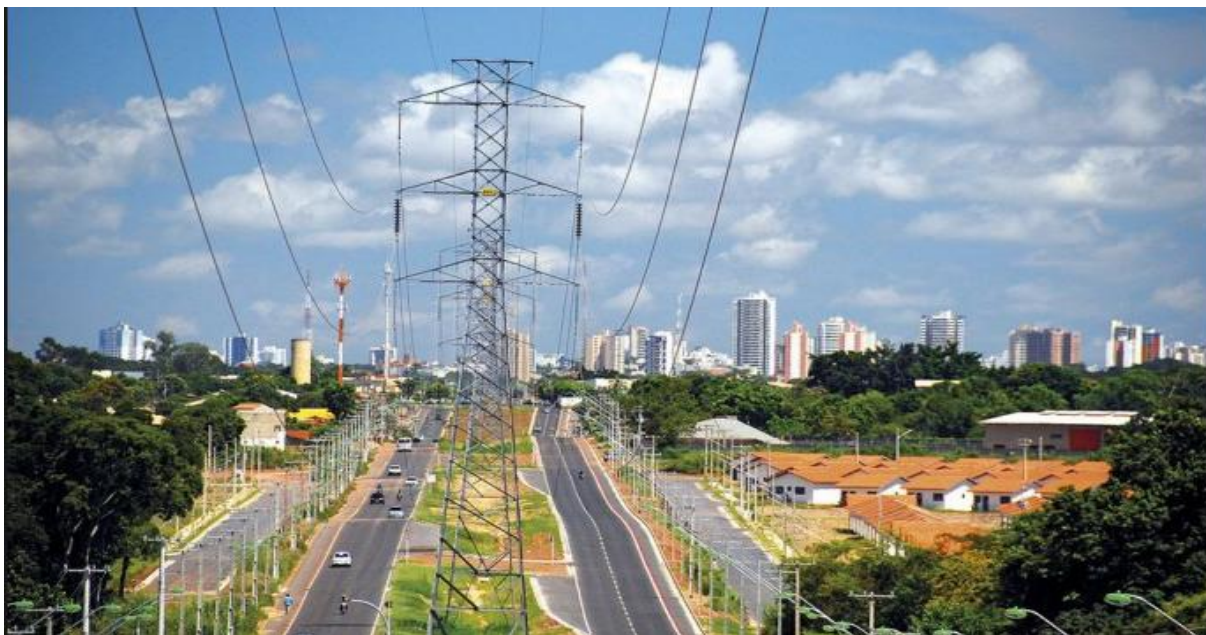
Figura 05- área arborizada da Av, das Torres para caminhada