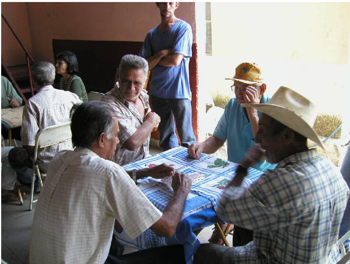
Figura 08 – Lazer da população idosa

É praticamente um consenso entre os profissionais da área da saúde que a atividade física é um fator determinante no processo de envelhecimento, sendo que, a qualidade da vida do idoso é determinada pelo grau de autonomia, ou seja, a capacidade de determinar e executar seus próprios desígnios.