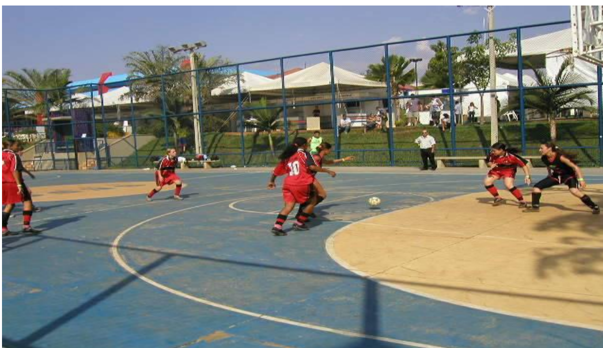
Figura 15 – Ilustração da prática de futebol de salão feminino