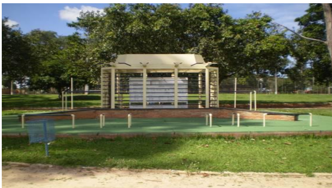
Figura 12 - ilustrativa de uma academia ao ar livre

01 professor de Educação Física (ou estagiário) para ministrar as atividades, designado pela Secretaria Municipal de Esportes ou contratado por ela para prestar serviço na atividade.