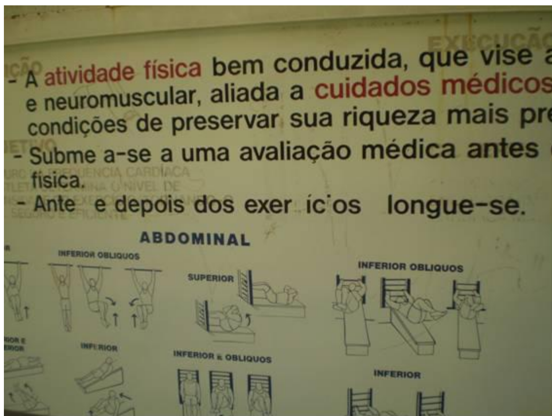
Figura 07 – Atividade Física

O avanço tecnológico propiciou uma elevação do nível de conforto, gerando um maior número de sedentários, levando a um impacto negativo na qualidade de vida das pessoas. O incentivo à prática da atividade física como meio de prevenção das doenças hipocinéticas, é uma forma de mostrar às pessoas que todas são capazes de fazer atividades físicas, com propostas simples e naturais, sem utilização de grandes recursos ou equipamentos, levando a pessoa a fazer da prática do exercício, um hábito de vida.