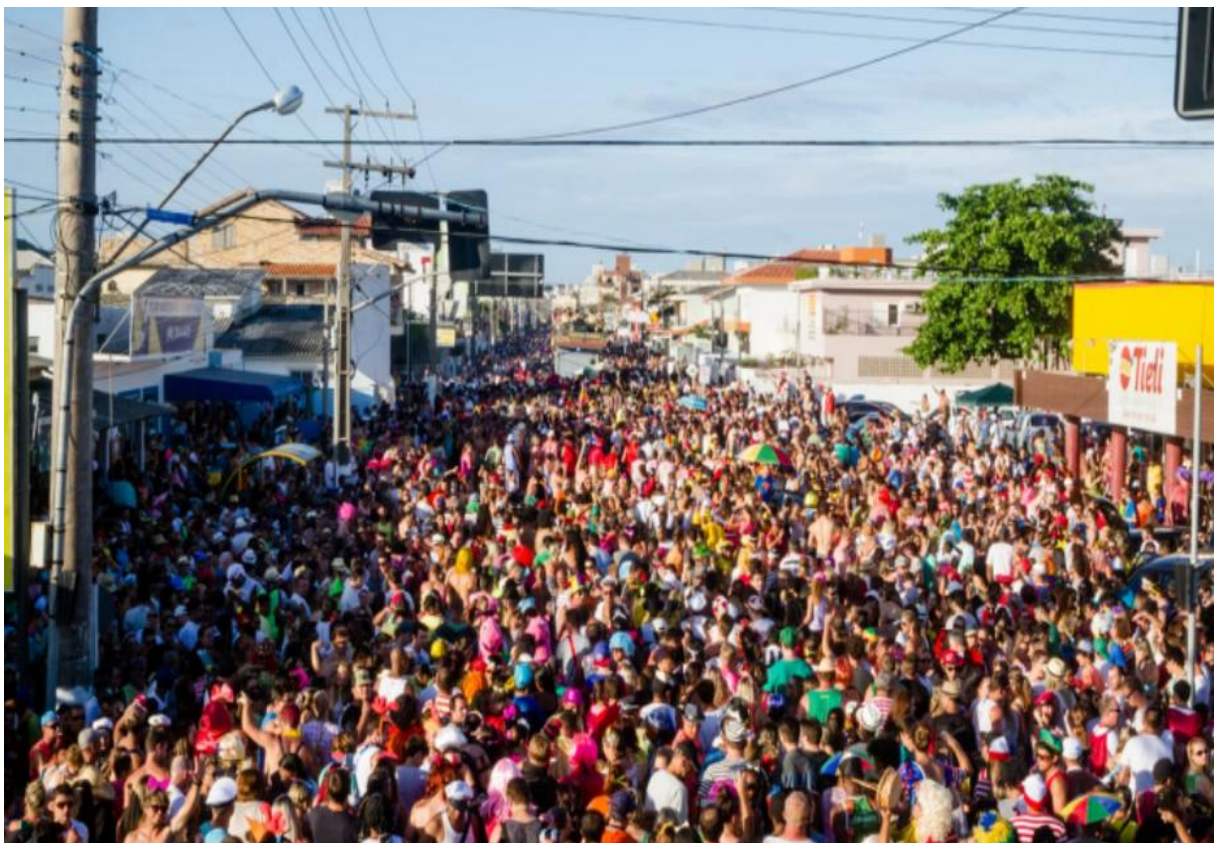
Figura 19 – Carnaval de Rua

Para que possamos elaborar esse projeto é indispensável as parcerias com a Polícia Militar e Corpo de Bombeiros. Salientando que: a ADP90 não economizará esforços para auxiliar na elaboração de projetos voltados para a segurança desta região. Contribuindo para a implantação de uma companhia de Corpo de Bombeiros um Batalhão da Polícia Militar e uma estrutura para Polícia Civil do Estado de Mato Grosso dentro da região do Pedra 90.