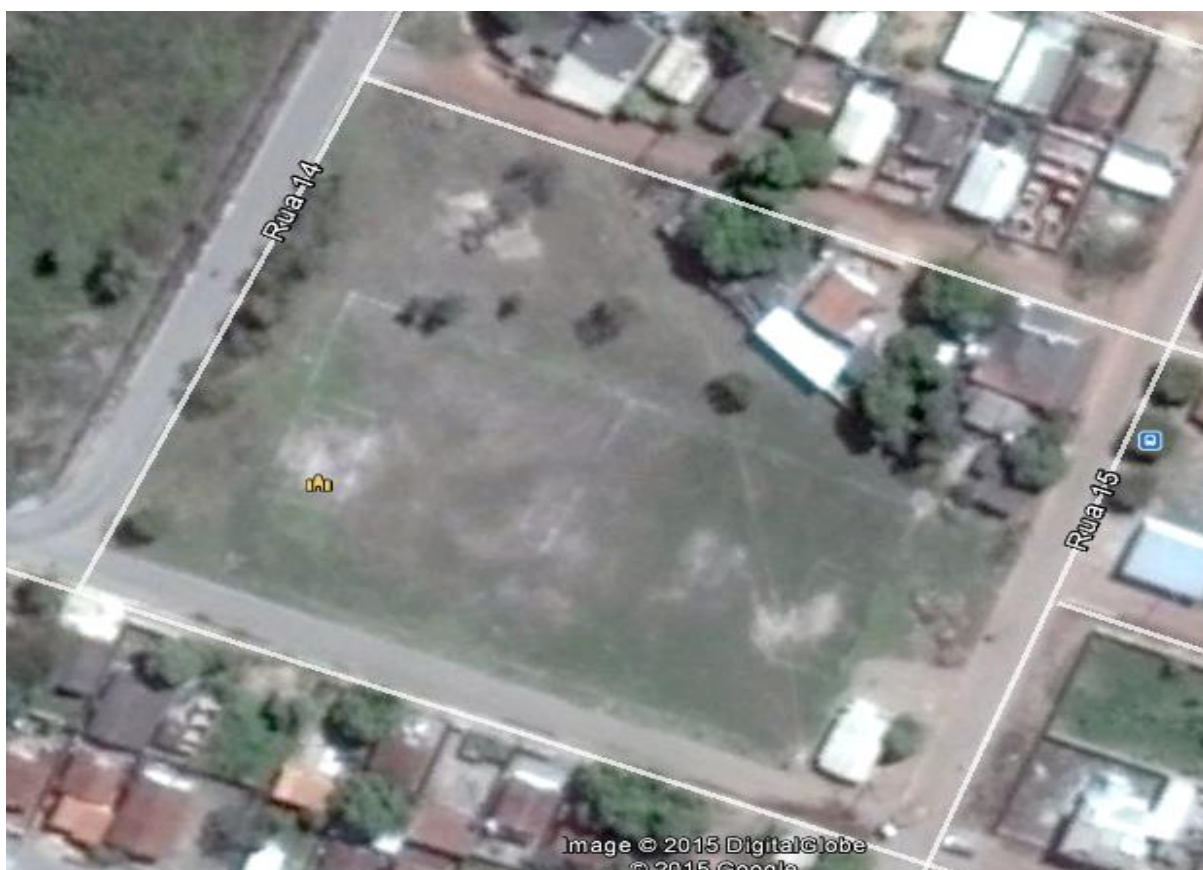
Figura 03 - Campo de Futebol do Bairro Voluntários da Pátria

No Bairro Voluntários da Pátria temos local de Campo de Futebol que devidamente reformulado serve para prática de vários esportes. Também existe um campo de areia que não está devidamente cuidado por falta de manutenção dessa praça de esporte que devidamente iluminado serve para prática de futebol no período noturno.