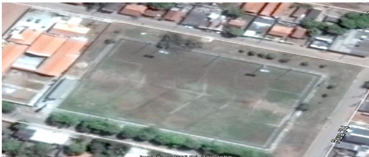
Figura 02 – Campo de Futebol do Bairro Pedra II Etapa

No Bairro Voluntários da Pátria temos local de Campo de Futebol que devidamente reformulado serve para prática de vários esportes. Também existe um campo de areia que não está devidamente cuidado por falta de manutenção dessa praça de esporte que devidamente iluminado serve para prática de futebol no período noturno.